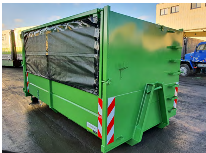
Kontejner s rolovací plachtou